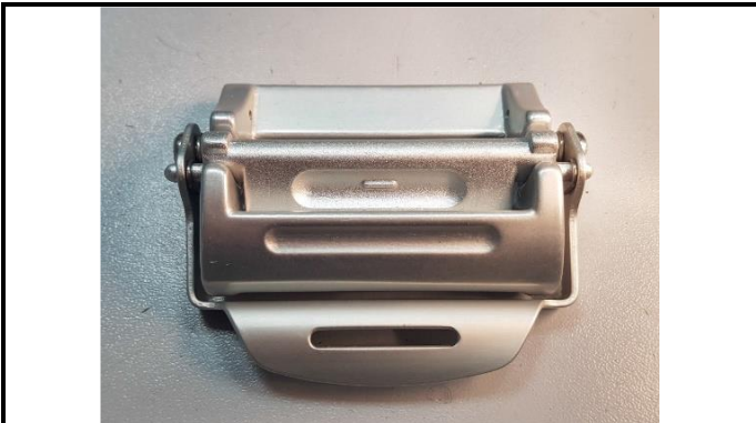
A2-1) Position / Position : Shoulder body straps (left & right)