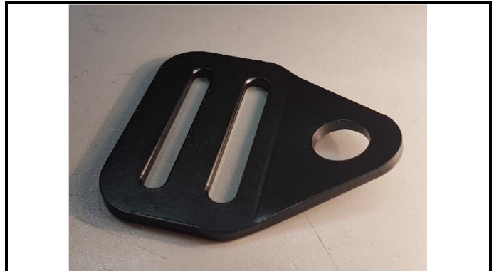
A2-2) Position / Position : Shoulder body straps (left & right)