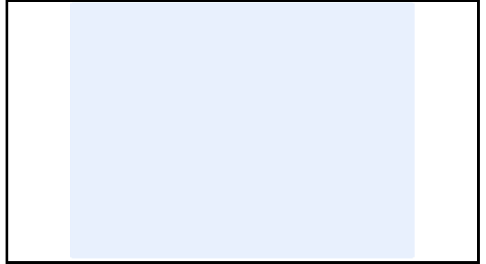
A1-4) Position / Position :