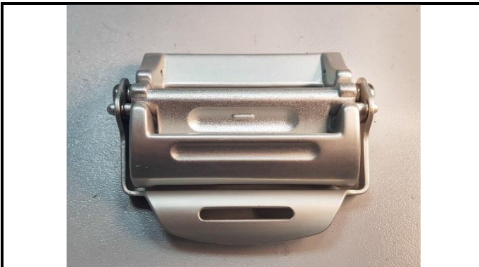
A2-3) Position / Position : Pelvic straps (left & right)