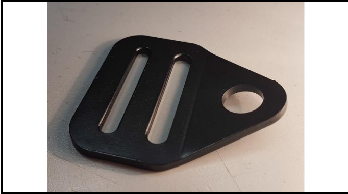
A1-3) Position / Position : Crotch straps (left & right)