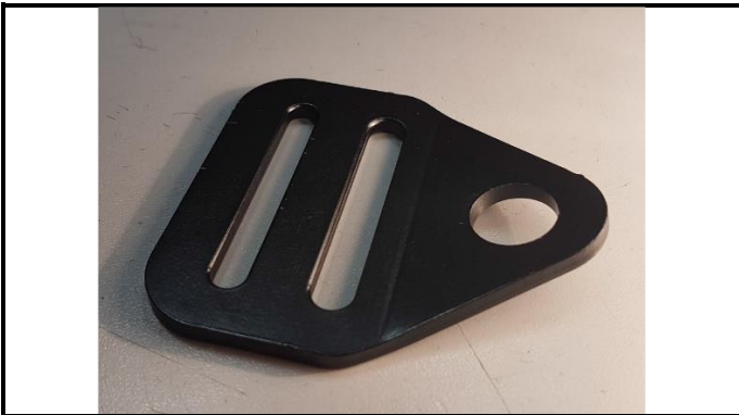
A1-1) Position / Position : Shoulder body straps (left & right)