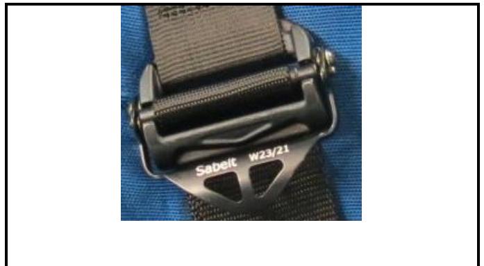
A2-2) Position / Position : left and right lap straps