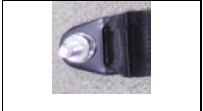
A1-4) Position / Position : right lap strap