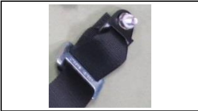
A1-5) Position / Position : left crotch strap