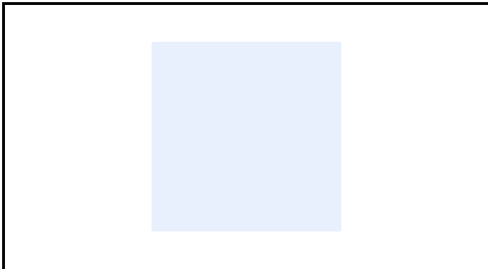
A2-3) Position / Position :