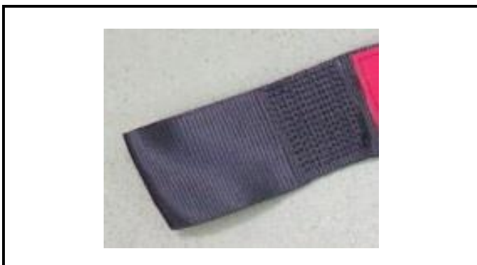
A1-1) Position / Position : left shoulder strap