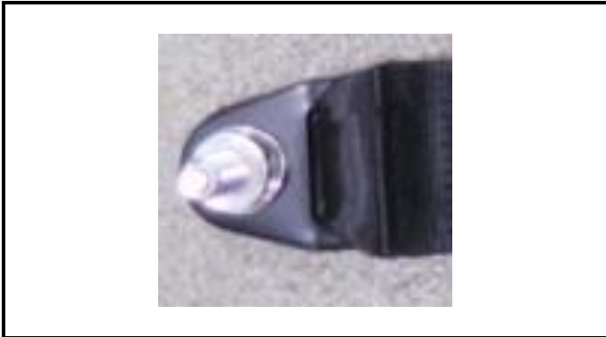
A1-3) Position / Position : left lap strap