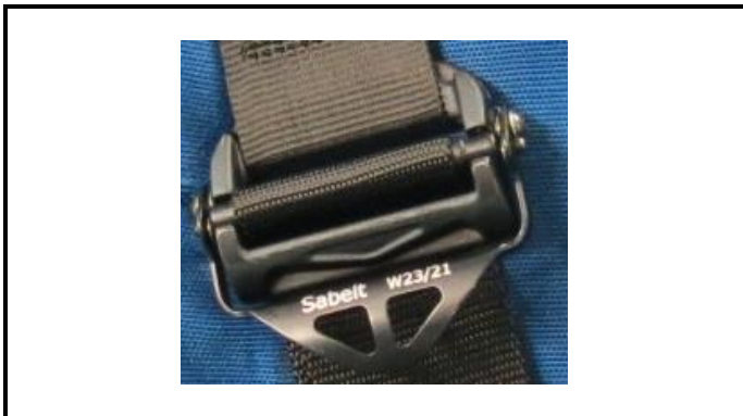
A2-1) Position / Position : left and right shoulder straps