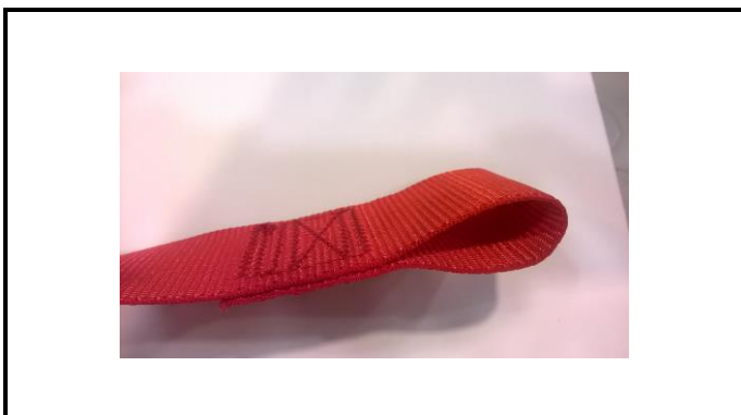
A1-1) Position / Position : left right shoulder strap