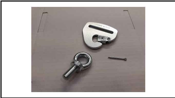
A1-5) Position / Position : left crotch strap