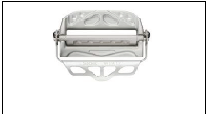
A2-2) Position / Position : left and right lap straps