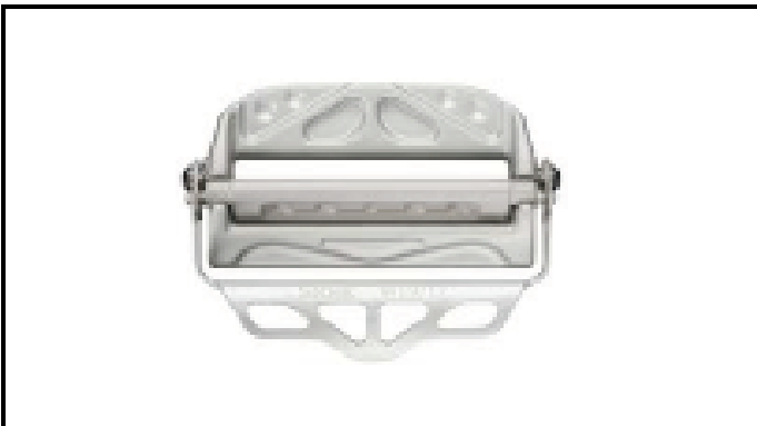
A2-1) Position / Position : left and right shoulder straps