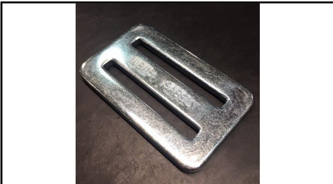
A2-3) Position / Position : left and right crotch straps