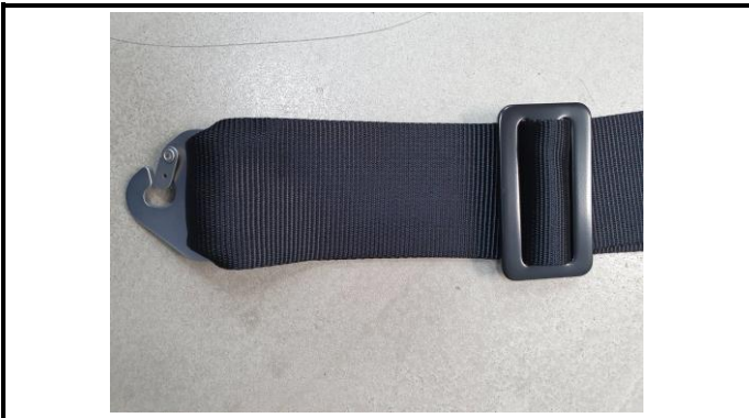
A1-1) Position / Position : Left Shoulder Strap