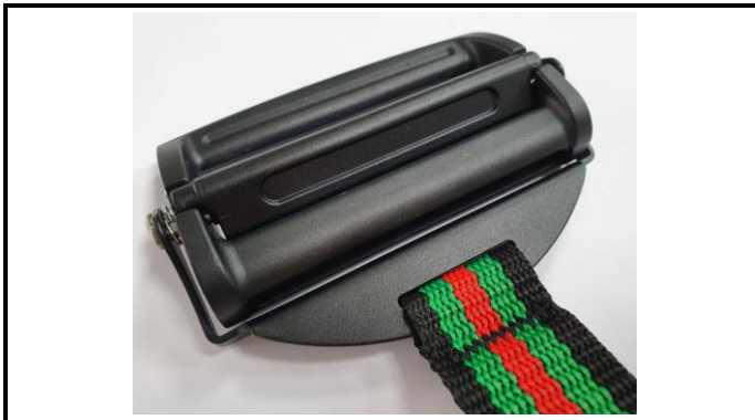
A2-3) Position / Position : Left Pelvic