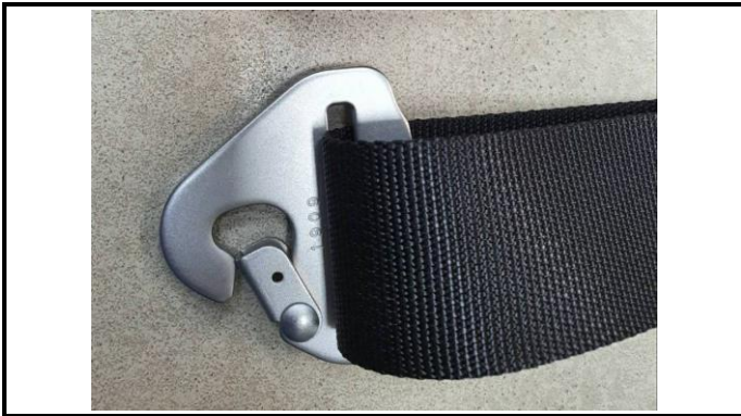
A1-5) Position / Position : Left Crotch Strap