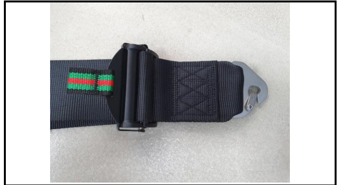
A1-4) Position / Position : Right Pelvic Strap