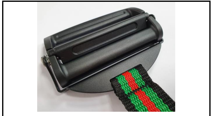
A2-2) Position / Position : Right Shoulder