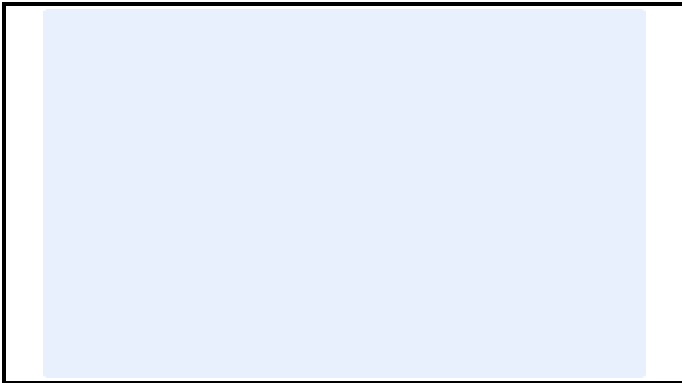
A1-5) Position / Position :