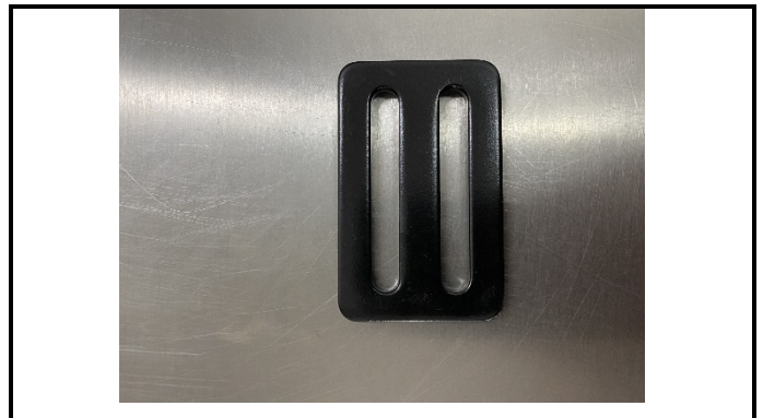
A2-2) Position / Position :