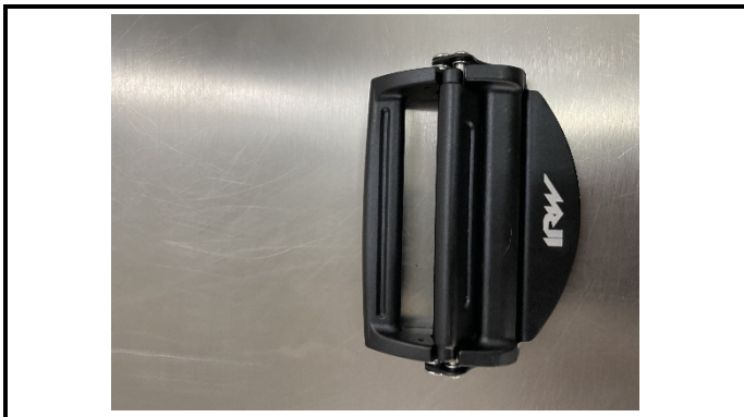
A2-1) Position / Position :