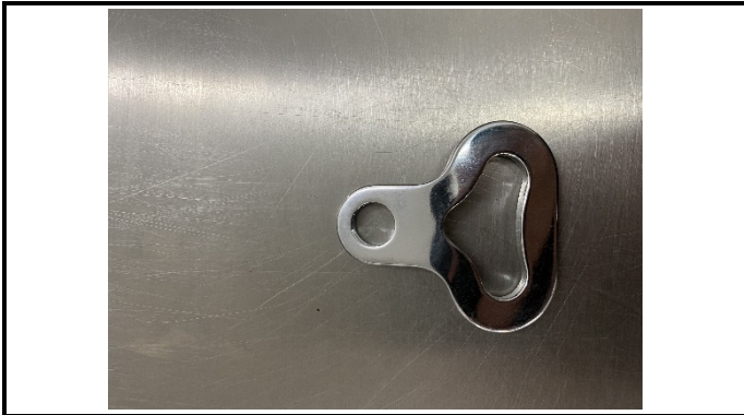
A1-3) Position / Position :