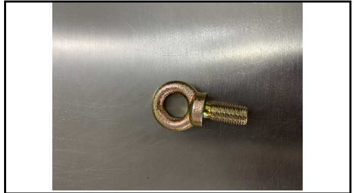
A1-4) Position / Position :