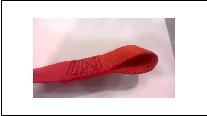
A1-1) Position / Position : left shoulder strap (body and Hans straps)