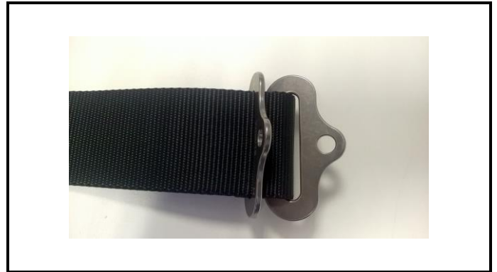
A1-4) Position / Position : right lap strap