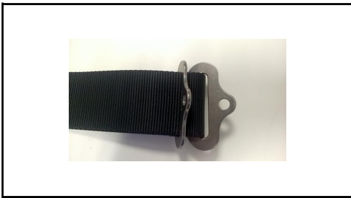
A2-3) Position / Position : left and right lap strap