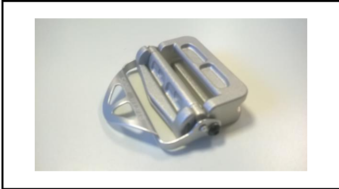
A2-1) Position / Position : left and right shoulder body straps