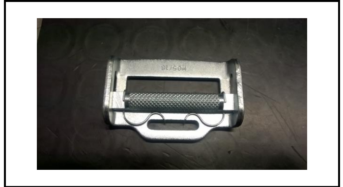
A2-2) Position / Position : left and right Shoulder Hans straps