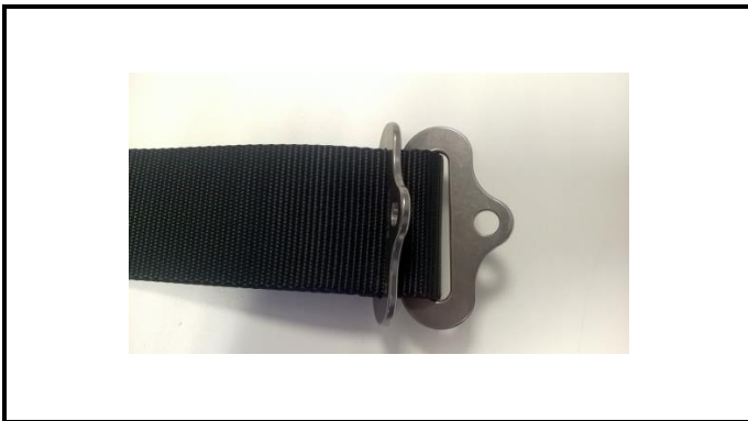
A1-5) Position / Position : left crotch strap