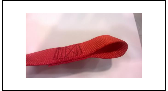
A1-2) Position / Position : right shoulder strap (body and Hans straps)