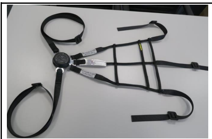
A1) Filet de course - photo vue de dessus (avant l'installation) Racing net – top view photo (before installation)