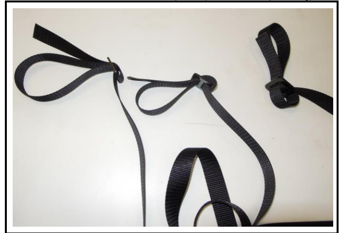
A4) Attaches arrière - photo 3/4 avant (détail de l'enroulement) Rear attachments - 3/4 front photo (details of strap routing)