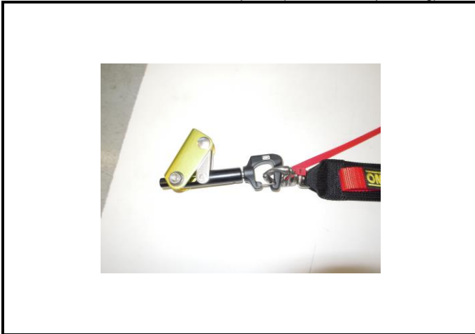
A3) Attache avant - photo 3/4 avant (détail de l'enroulement) Front attachment - 3/4 front photo (details of strap routing)