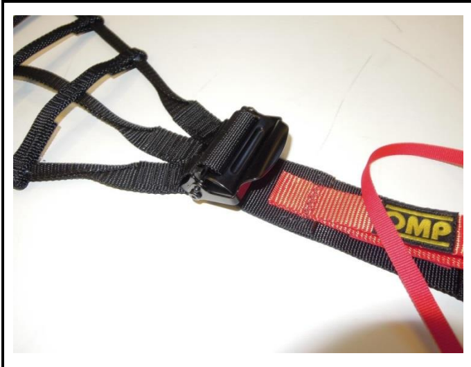
A5) Autre hardware - photo 3/4 avant Other hardware - 3/4 front photo (adjuster)