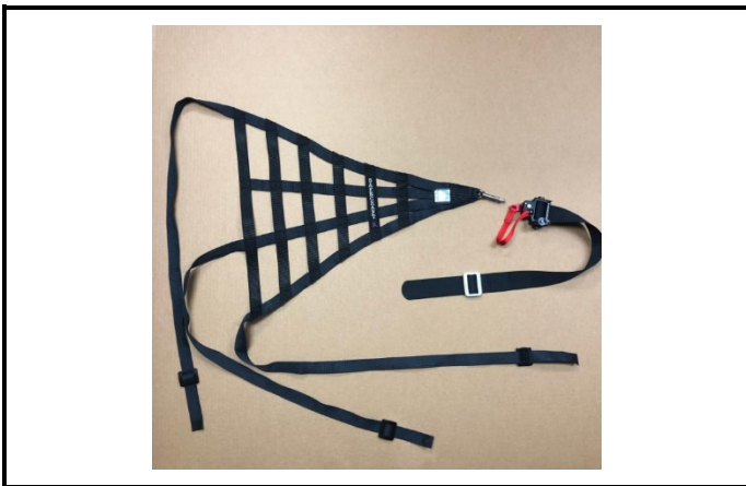
A1) Filet de course - photo vue de dessus (avant l'installation) Racing net – top view photo (before installation)