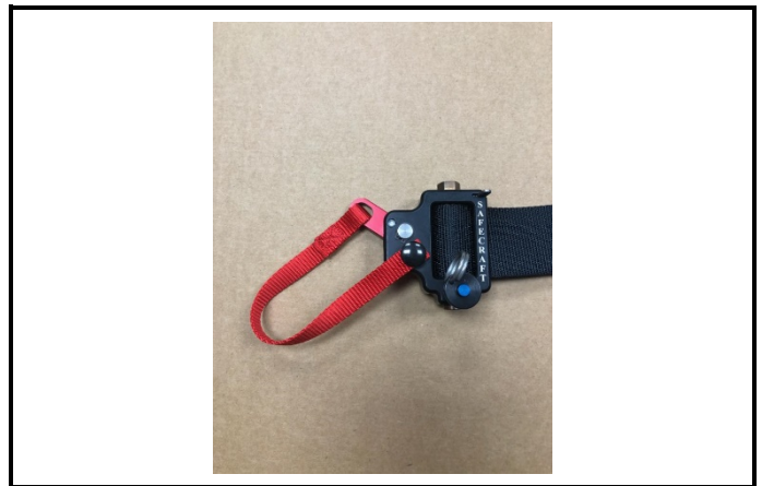
A2) Mécanisme de déverrouillage rapide - photo 3/4 avant (avec indication du système d'ouverture) Quick release system - 3/4 front photo (with opening system indicated)