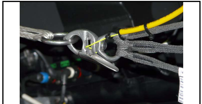
A2) Mécanisme de déverrouillage rapide - photo 3/4 avant (avec indication du système d'ouverture) Quick release system - 3/4 front photo (with opening system indicated)