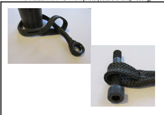
A3) Attache avant - photo 3/4 avant (détail de l'enroulement) Front attachment - 3/4 front photo (details of strap routing)