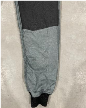
Photo de l'option boot cut Photo of boot cut option