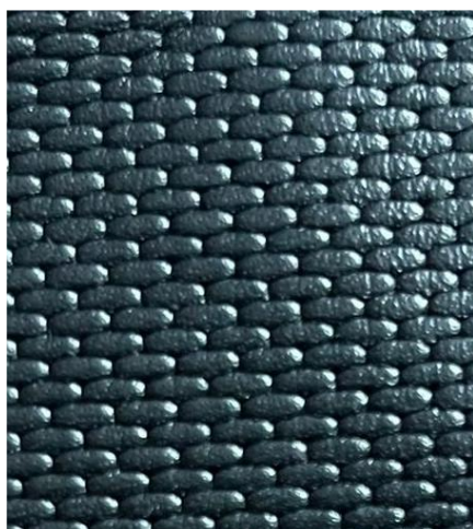
Smooth leather patterned