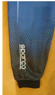
Photo de l'option boot cut Photo of boot cut option