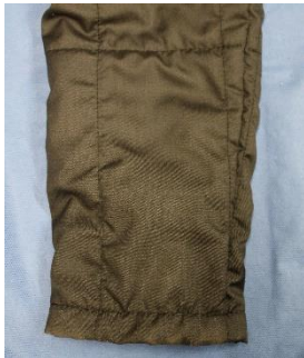
Photo de l'option boot cut Photo of boot cut option