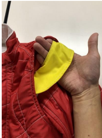
Les couleurs peuvent être modifiées. Colours may be changed.

B1) vue de ¾ avec position de la main pour saisir la poignée ¾ view with position of the hand for grabbing the handle