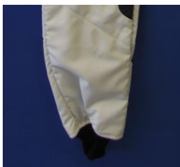
Photo de l'option boot cut Photo of boot cut option