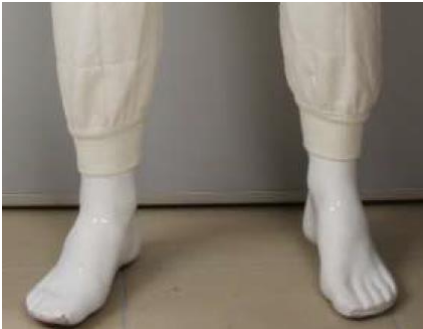
Photo de l'option boot cut Photo of boot cut option