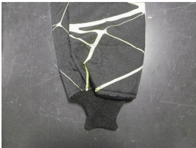
Photo de l'option boot cut Photo of boot cut option