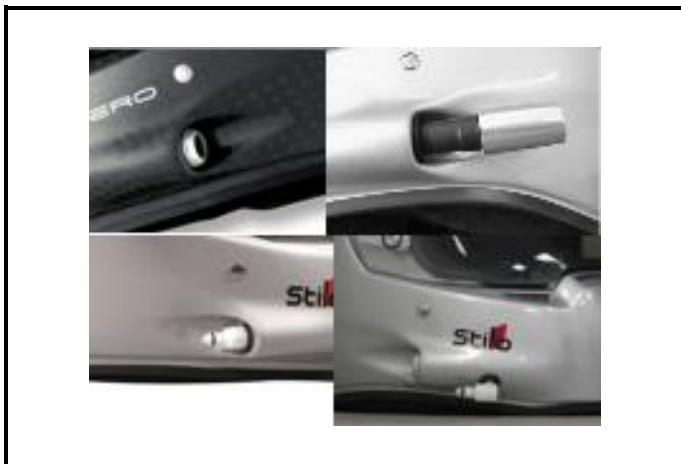
E3) Side port components