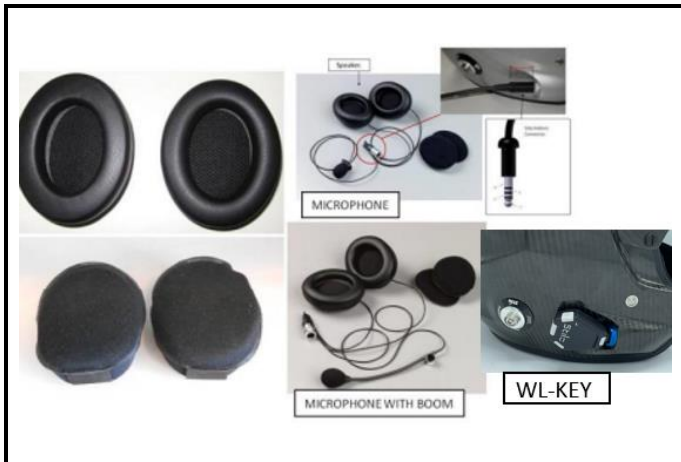
E1) EAR CUPS INTERCOMS