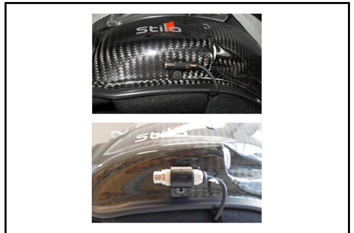
E2) Clip earplugs connector