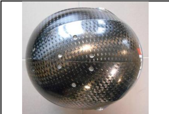
D3) Vue de haut / Top view