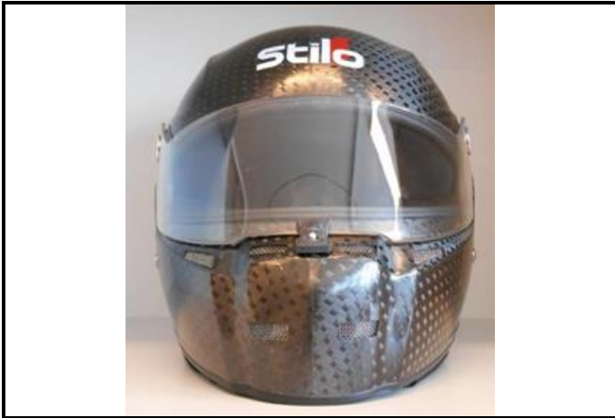
D1) Vue de face / Front view