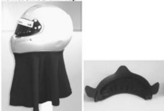
Helmet skirt & Chin flap