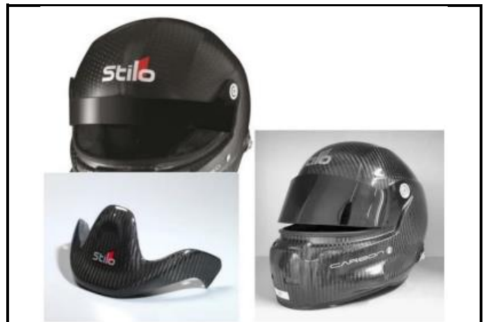
E4) PEAK and SHORT VISOR