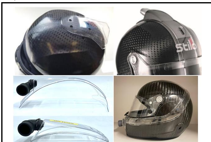
E5) TOP-AIR and forced ventilation for CHIN and TOP