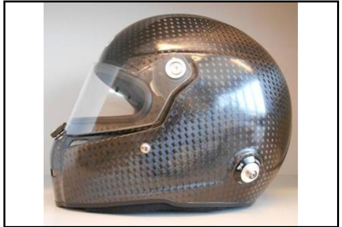
D2) Vue du Côté Droite / Right Side view