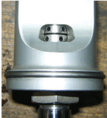
Monotube réglable dans les deux sens / Double adjustable monotube

Lorsque des cartouches MacPherson pour jambes de force monotubes (installation à l'envers) sont utilisées, le diamètre du tube visible (pas du corps de la jambe) doit être conforme au diamètre de période. Les Escorts, Mark 1 et 2, utilisaient d'ordinaire des cartouches Bilstein en période, monotubes, non réglables, avec un diamètre de tube de 41 mm. Des cartouches de 50 mm étaient utilisées sur la Lancia Stratos et la Fiat 131. Un dispositif de réglage au sommet de la jambe de force peut correspondre à une conception monotube réglable. Les réservoirs non incorporés sont d'une spécification ultérieure.