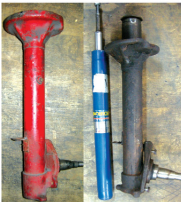
Jambes de force MacPherson / MacPherson struts

A damper that incorporates two adjusters in one mounting eye (as seen on the left but numerous versions exist) will be a monotube damper. To give an idea of scale, the holes in the adjuster wheels on this particular unit are just over 1 mm in diameter.