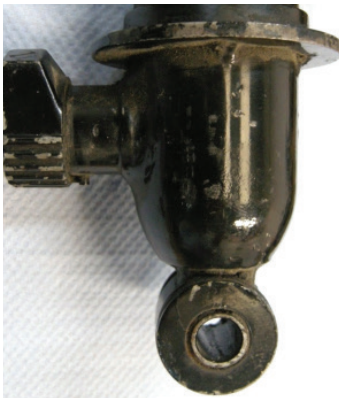
Armstrong à réglage unique / Armstrong single adjustable