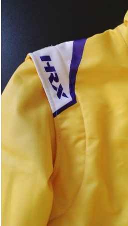
Photo de la Manche flottante (arrière) Photo of the Floating Sleeve (back)