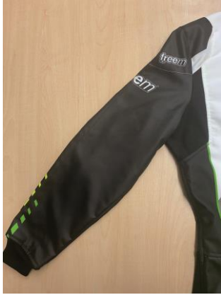
Photo de la Manche flottante (arrière) Photo of the Floating Sleeve (back)