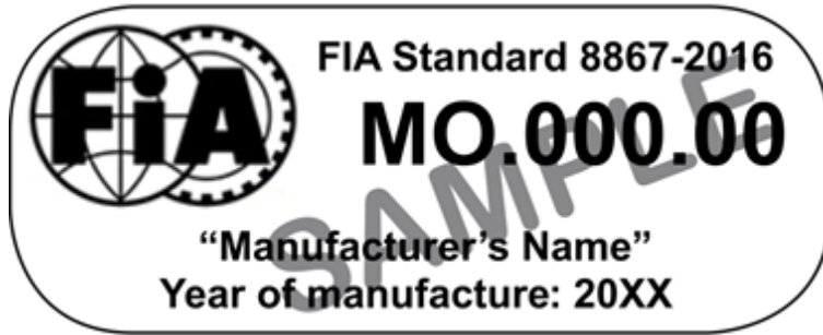
Figure 1. Modèle d'étiquette d'homologation Figure 1. Sample of homologation label